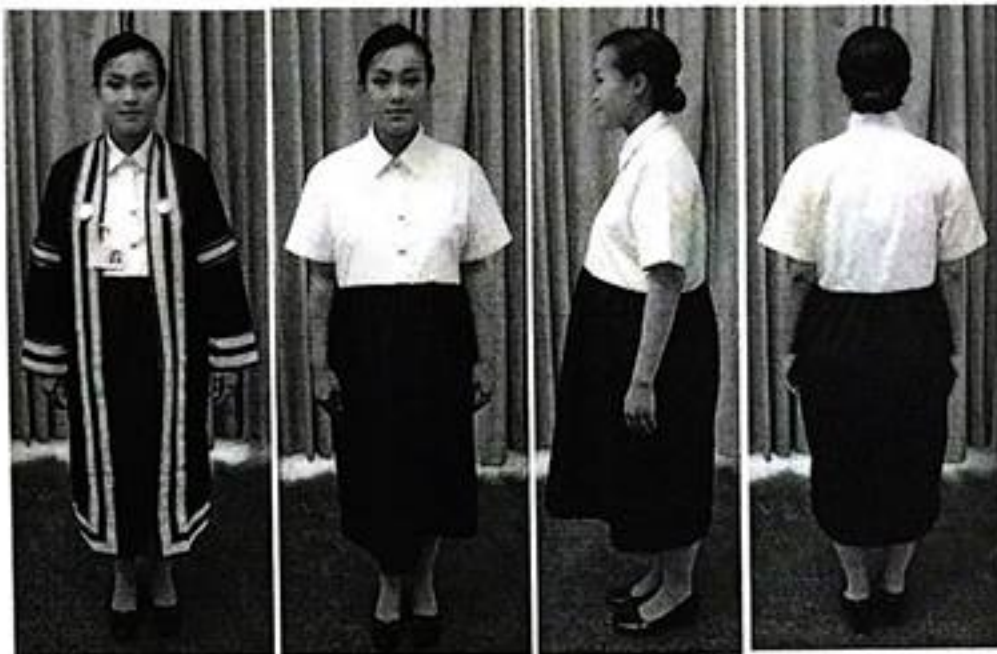
ชุดคลุมห้อง แบบที่ ๑ ผ้าหน้าสวมหัวได้