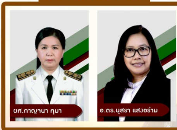
มศ.กานานา กูมา