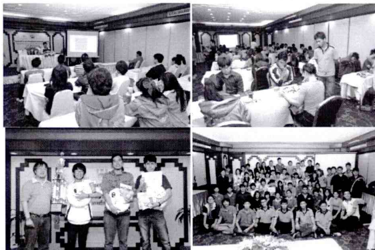
ณ. โรงแรมเชียงใหม่ ออคิด จังหวัดเชียงใหม่ (10 สถาบัน ผู้เข้าร่วมงาน 96 คน)

สอบถามรายละเอียดได้ที่คุณธัญญารัตน์ โรจนมันัสชัย (คุณลิลิ)