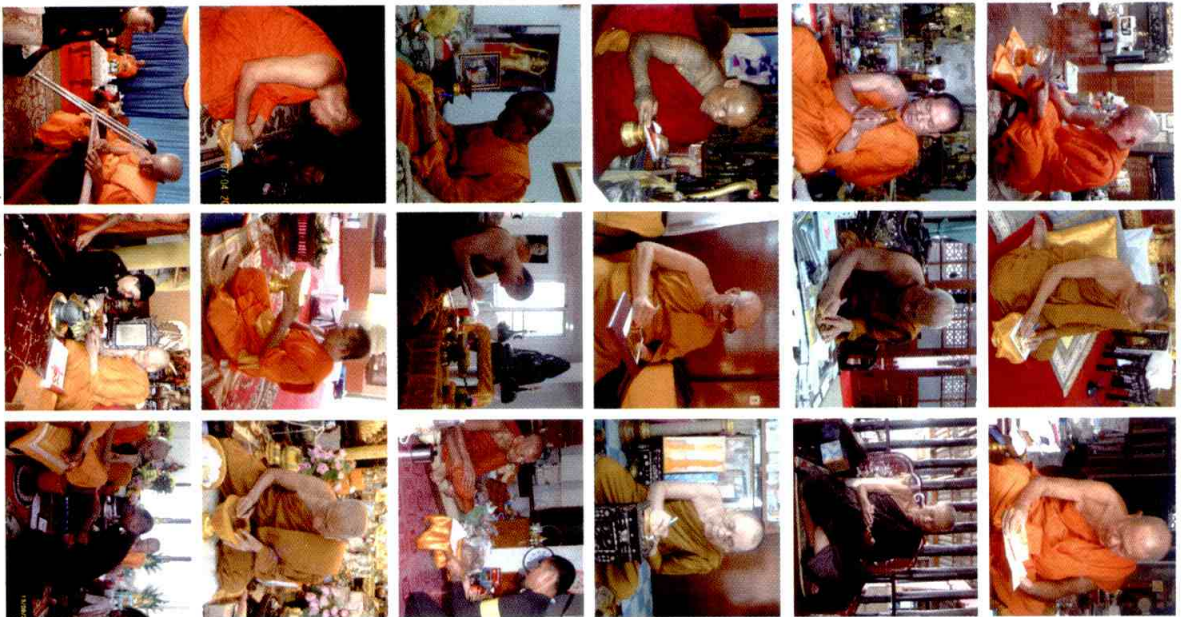
พระเกจิอาจารย์ชื่อดังทั่วประเทศ ลงอักขระและอธิษฐานจิต