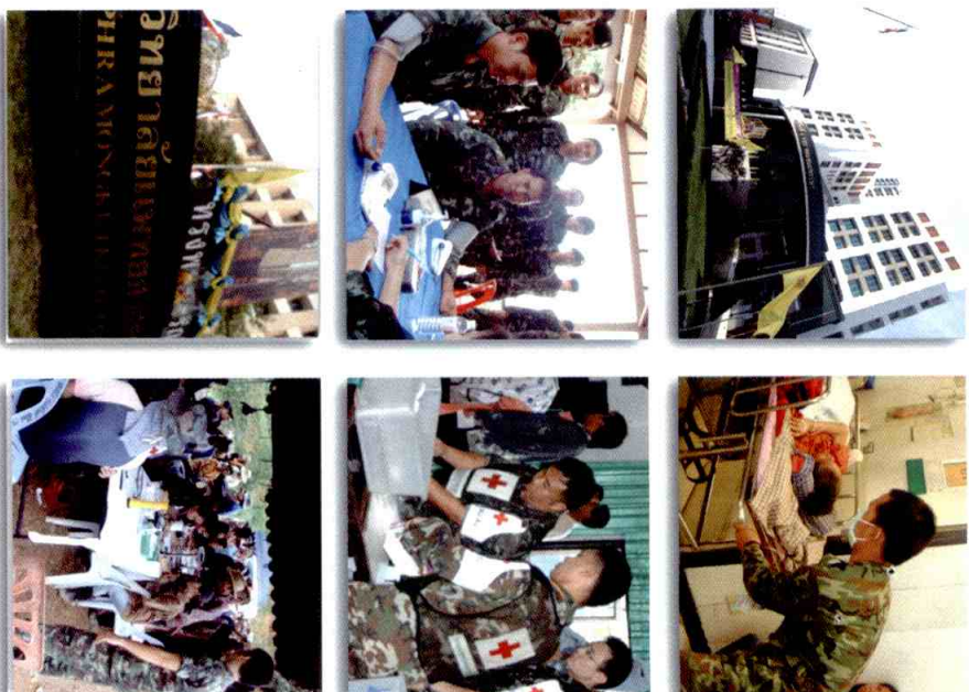
สภามหาเถรสมาคม ส่งบุคลากรทางการแพทย์ให้แก่วัทยาบาล

ในสังกัดกองทัพบก จำนวน ๓๗ แห่งทั่วประเทศ