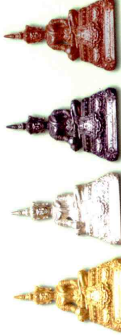
เนื้อทองคำ