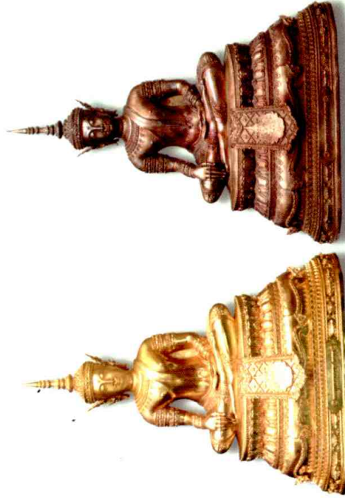
เนื้อกะหล่ำทอง

พระพุทธรูปทรงเครื่องเป็นศิลปะในยุคสมัยรัตนโกสินทร์