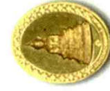
เนื้อทองคำ