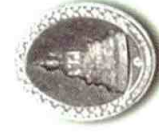
เนื้อเงิน