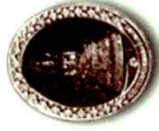
เนื้อนวโลหะ