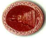
เนื้อทองแดง